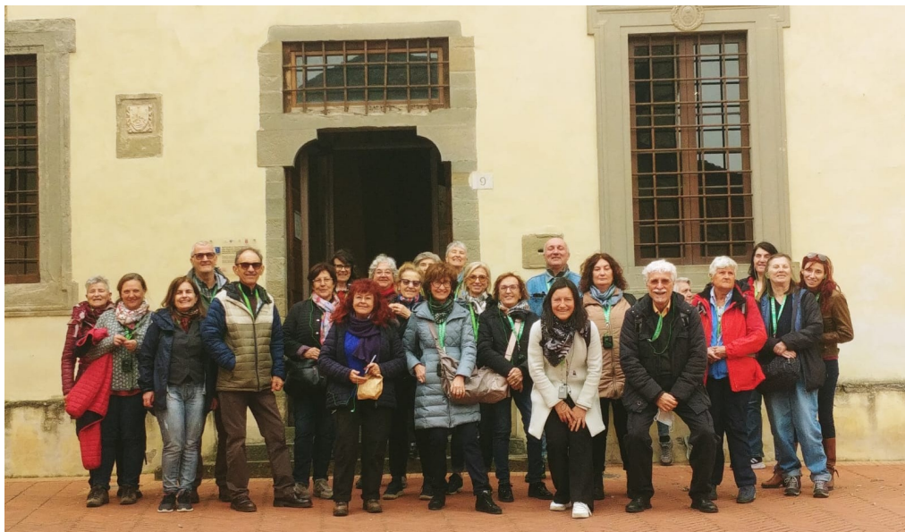
1° Aprile 2024 Pasquetta ad Anghiari (sopra) e dentro il Museo Civico di Sansepolcro davanti alla “Resurrezione” di Piero della Francesca